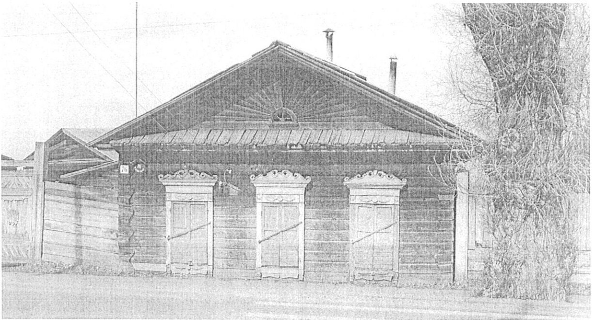
Фото 2. г. Енисейск, ул. Ленина, 76, вид с юго-запада