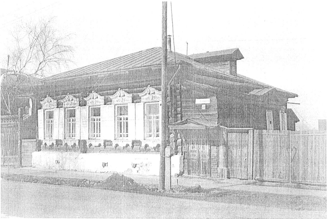
Фото 3. г. Енисейск, ул. Ленина.80, вид с юго-востока